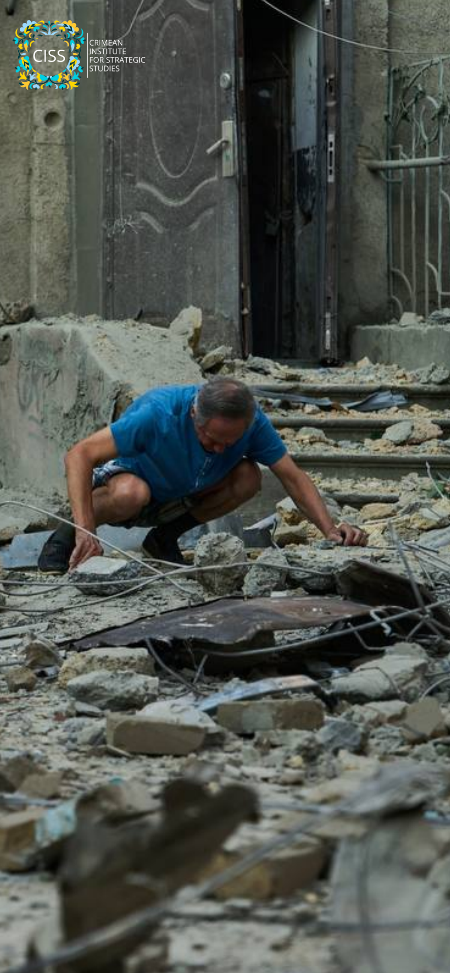
Руйнування в центрі Одеси внаслідок обстрілу 23 липня 2023.