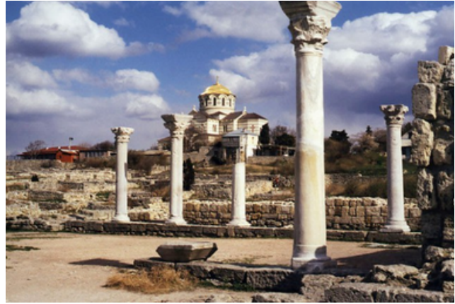
Херсонес під російською окупацією

Найбільші втрати археологічній спадщині Херсонеса завдали незаконні розкопки "під знесення" його передмість у 2020–2021 рр. Перед російськими археологами постало завдання – очистити ділянку для будівництва розважального комплексу "Новий Херсонес", провідним завданням якого є возвеличення міфу про "колиску православ'я".