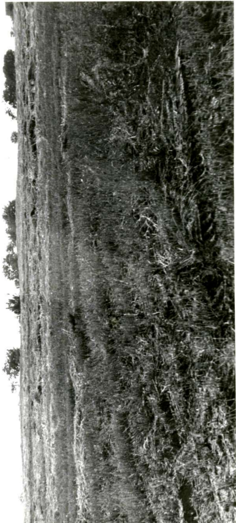
Курганный могильник. Запорізька область, Василівський район, с. Малі Щербаки, Сухоїванівської сілради, за 2 км на південь від села.