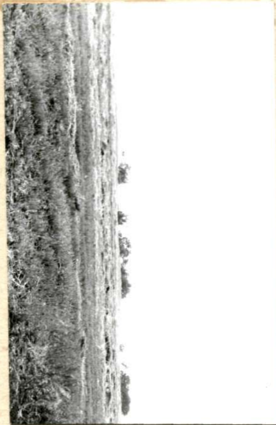
Фото або схематичний план