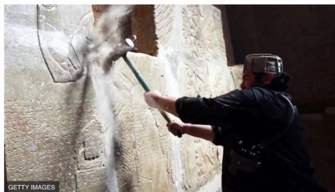
Джихадист ІД знищує барельєфи у місті Німруд

"Потрібно викинути їх з ЮНЕСКО, з Ради з прав людини викинути. Час викинути з організації, яка займається культурою та спадщиною. Культурі в них немає, а спадщину руйнують щент", - закликав експерт.