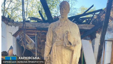
ХАРКІВСЬКА ХАРКІВСЬКА ОБЛАСНА ПРОКУРАТУРА

Після пожежі збереглася скульптура Григорія Сковороди, створена Ігорем Ястребовим